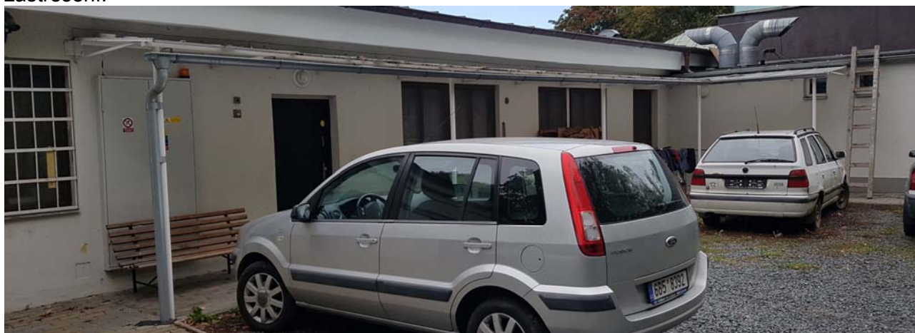
Stávající. kovová konstrukce zastřešení.

SO 03 - Bude odstraněn stávající dvorní přístřešek - ocelová konstrukce cca 0,15 t, polykarbonát krytina 32,2 m 2 . Viz D.1.1.b)02.2_PŮDORYS 1.NP - bourání viz. fotografie stav kovové konstrukce zastřešení.