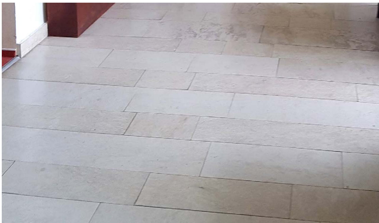
Stávající mramorová dlažba v prostoru muzea

Ve stávajícím objektu muzea bude ve vstupní hale vybourán otvor ve střední nosné zdi na celou šíři foyer, střešní konstrukce bude nad tímto otvorem vynášena novými ocelovými nosníky. Budou zazděny některé dveřní a okenní otvory a zbudovány nové. Budou vybourány stávající podlahové krytiny z kamenné a keramické dlažby a provedena jednotná dlažbě z velkoformátových keramických prvků. Dlažba stejného formátu a vzhledu a spárořezu jako stávající mramorová dlažba v prostoru muzea, tj. spárořez na nepravidelnou vazbu, pruhy cca 20/30cm široké, délka 30,50,70,90 cm, včetně soklu 10cm, lepená, leštěný povrch, protiskluznost min. R10, impregnace, barevnost krémově bílá, světle teple šedá, nevýrazná kresba, bude vzorkováno. Viz foto stávající mramorová dlažba v prostoru muzea.