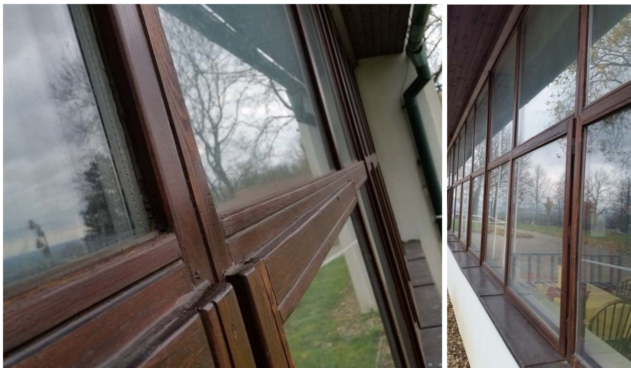
Stávající mramorová dlažba v prostoru muzea

Vitríny v návštěvnickém prostoru a kuchyňská linka - nebudou součástí dodávky. Bude z jiného rozpočtu.