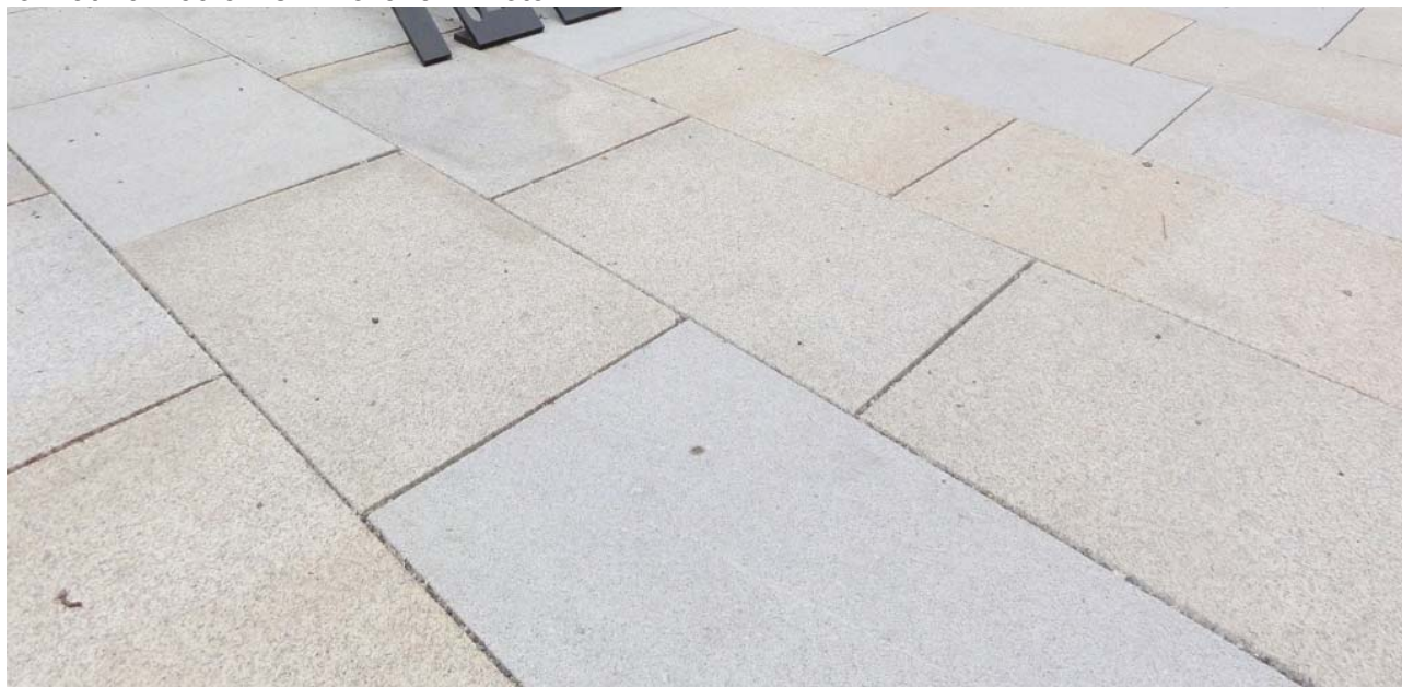
Žulová dlažba – formát 40x60, smrkovaná

prvku. Žulová dlažba – formát 40 x 60 cm, smrkovaná, protiskluznost R11, světle šedá - béžová, bude vzorkováno, spárořez viz. výkres D.1.1.b)2, pokládka viz. skladba D.1.1.b)601. Žulová dlažba formát 40 x 60 cm smrkovaná viz foto.